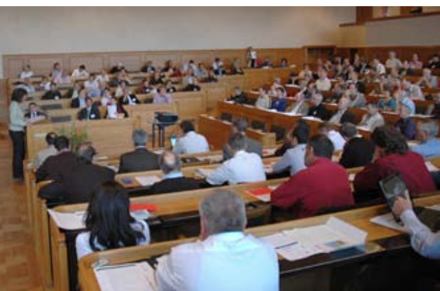
Echanges de vues entre 200 personnes au Rathaus