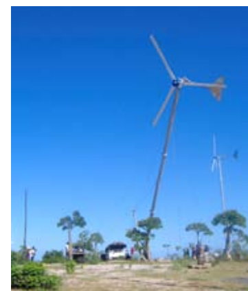
Participation citoyenne à Madagascar