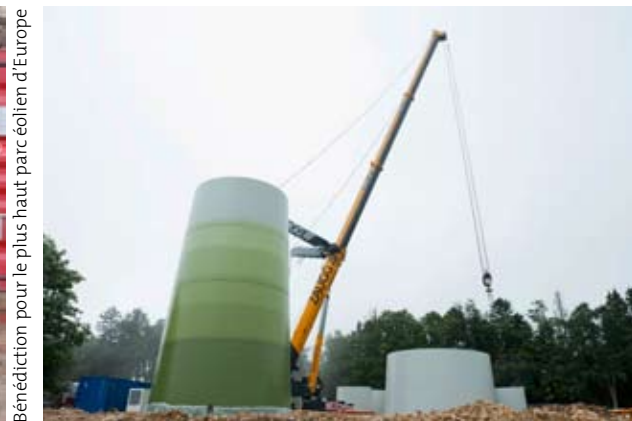
Bénédictio pour le plus haut parc éolien d'Europe