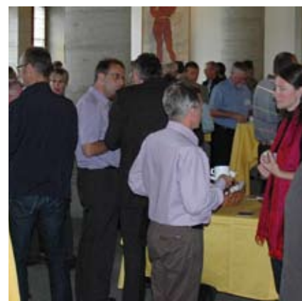
La discussion se poursuit à la pause