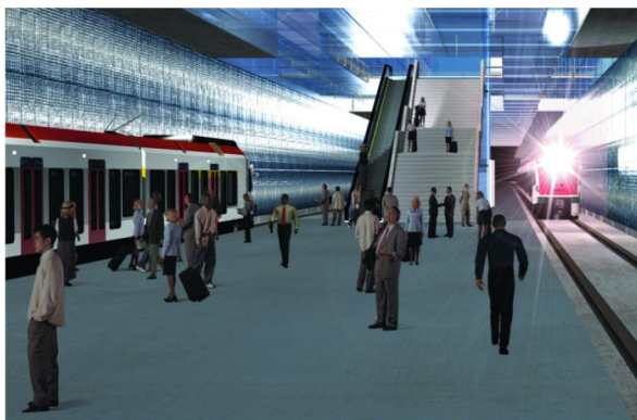
Future gare souterraine des Eaux-Vives