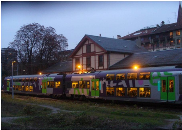
Actuelle gare des Eaux-Vives